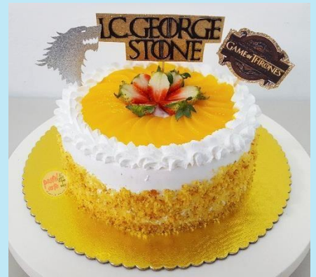
DULCE FRIO DE FRUTAS 6" CON TOPPER SENCILLO