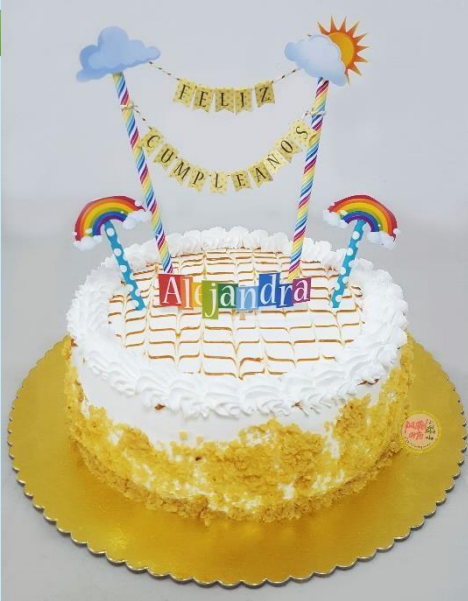
TRES LECHE 6" CON TOPPER SENCILLO